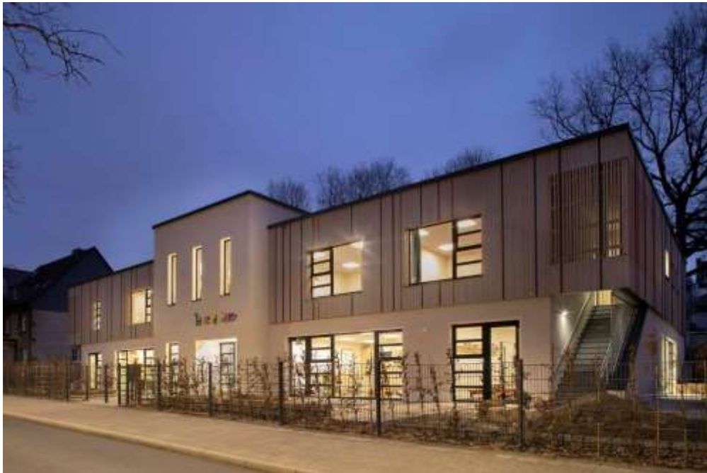
Abb. 1: Projekt von Nils Schäfer: Außenansicht der Kindertagesstätte Tausendfüßler im denkmalgeschützten Ensemble mit der Lutherkirche in Bochum, mit SPIRIT geplant.

Urheber: Architekten Kremer & Partner, Bochum