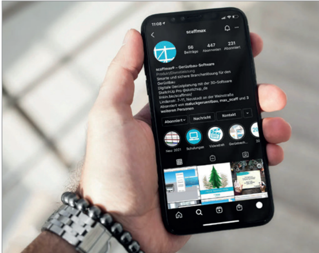
Instagram & Co. sind wichtige Informationsquellen für Gerüstbauer