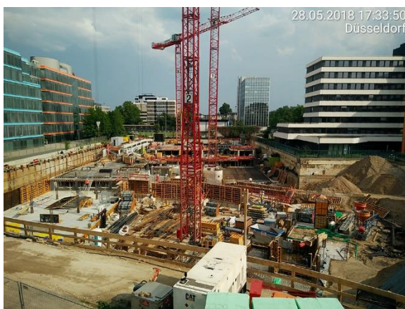
Abb.3: Blick über die Baustelle des Bürogebäudes in Düsseldorf Urheber: Gustav Eppler Bauunternehmung GmbH, Stuttgart